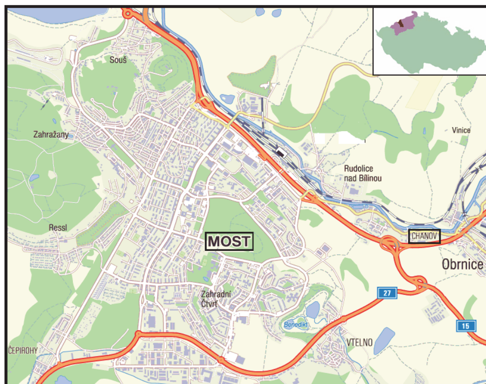
Obrázek 2 | Lokalizace Mostu a Chanova